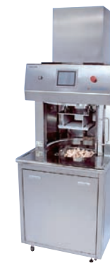
シリコセン洗浄機