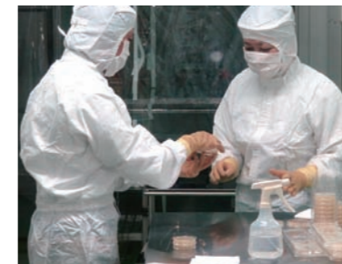
更衣バリデーション

昨年に世界品質の無菌医療機器製造を目指して新開発センターを竣工稼働させました。お陰さまで環境と設備と人材が一体となった洗浄・滅菌システムは順調に始動し、それまでに比べて更に高品質の製品がお客様の手元へ届くようになっています。しかしながら洗浄・滅菌システムから生み出される高品質な製品をそのままの品質でお客様の製造工程へ届けるには、洗浄・滅菌システムのGMPだけでなく、包装、出荷、輸送、受入れ、客先の生産ラインへ供給までのトータルシステムを私たち受託業者とお客様で作り上げる時代となっています。