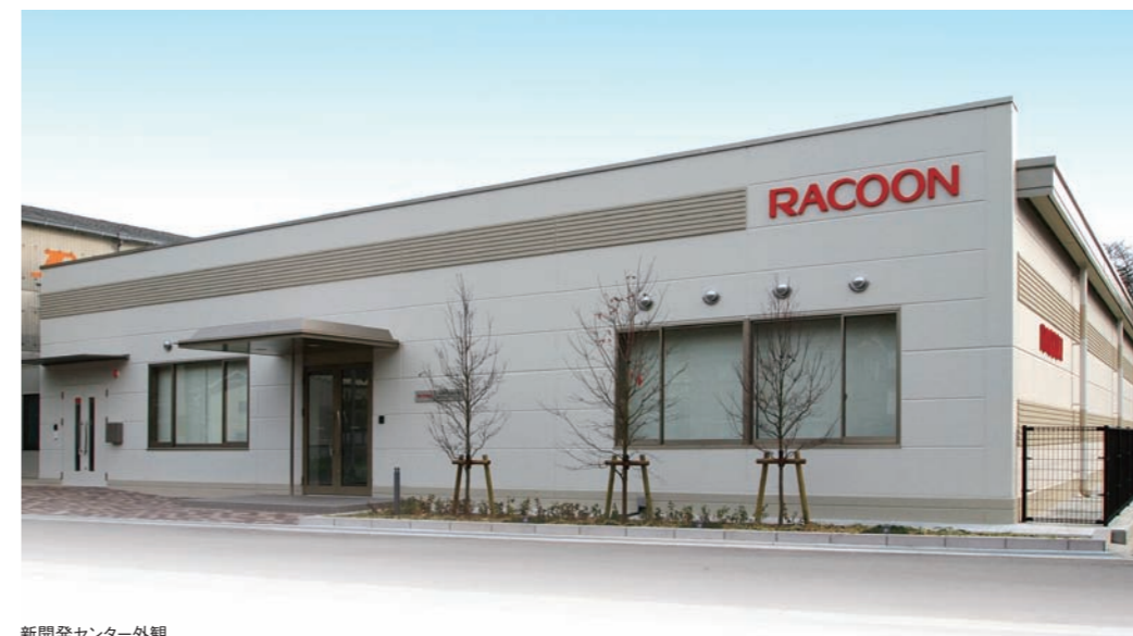
新開発センター外観