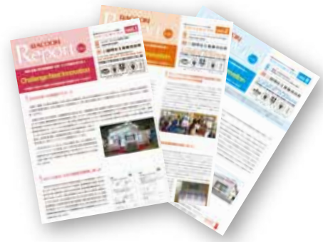
ラックーンレポート