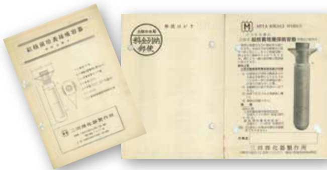
昭和30年頃の結核菌培養採痰容器資料(左)と案内はがき(右)